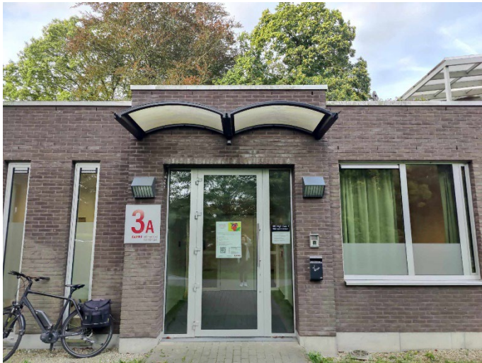
Ingang High Care 1 (HC1)

Je ontvangt deze brochure omdat een familielid of naaste is opgenomen. Een opname in een psychiatrisch ziekenhuis brengt soms veel emoties met zich mee. Met deze brochure hopen wij meer duidelijkheid te kunnen bieden over de afdeling. Neem je tijd om de brochure door te nemen en daarnaast ben je met jouw vragen welkom bij onze medewerkers van het team.