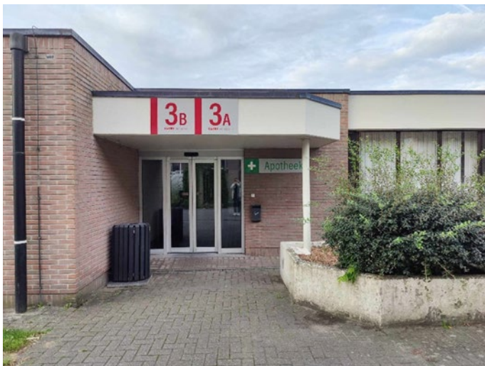
Ingang High Care 2 (HC2)